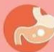
Проблемы с ЖКТ у детей